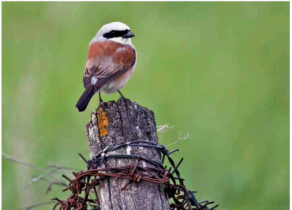
Grauwe klauwier.

Een klein vogeltje. Kind aan huis in halfopen landschappen in Nederland en België die meestal door mensen zijn gevormd. Maar het waren ook weer die mensen die door de intensivering van de landbouw de grauwe klauwier het leven onmogelijk maakten. Tot het ineens in het Bargerveen beter ging. Het begin van een intensief onderzoek. Wat is er aan de hand, wat is er gebeurd? “Door ons te verplaatsen in de dieren in het gebied kom je er achter waar de knelpunten liggen en waar de positieve ontwikkelingen zijn.” Insecten spelen een belangrijke rol, bijvoorbeeld omdat zij een voedselbron voor andere dieren zijn of omdat ze voor bestuiving van planten zorgen. Insecten reageren vaak snel op veranderingen in hun omgeving, omdat ze een korte levenscyclus hebben. Dat maakt het extra interessant om te kijken waar soorten wel voorkomen en waar niet? Wat zijn de eigenschappen van die soorten en van hun omgeving? Wat ontbreekt er in het landschap en hoe krijg je dat weer terug? “Wij bleven niet in een hokje zitten, maar gingen op zoek naar waar in het systeem het mis ging.” Uiteindelijk is een systeem ontstaan, een andere manier van kijken, een methode. Stichting Bargerveen ging een stap verder en zette de vergaarde wetenschappelijke kennis in om ook elders problemen op te lossen waar beheerders en beleidsmakers tegenaan lopen.