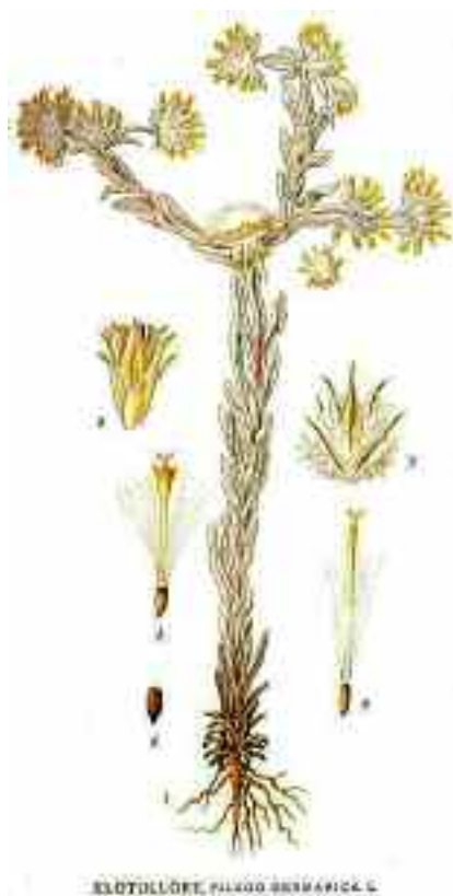
KLUTELLÖRE, PILAGO BERGAMICAE

Ziet u ook iets bijzonders op een van onze percelen, dan horen we dat graag.