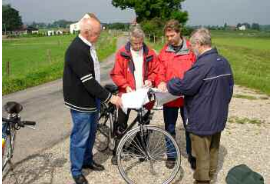
Werkgroep Veldnamen op veldtocht

Ook via zijn wekelijkse bijdrage aan Radio Groesbeek, in de rubriek Plantaar-dig , bereikt hij een grote groep mensen, die wellicht (ook) nog nooit gehoord hadden van het Kardinaalsmutsstippelmotje, maar er toch op hun volgende zondagse wandeling op gaan letten. Be-