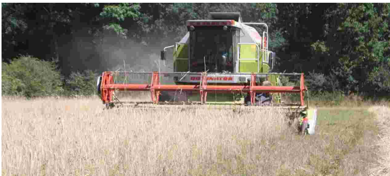
Het maaien en dorsen van de winterrogge op 3 augustus