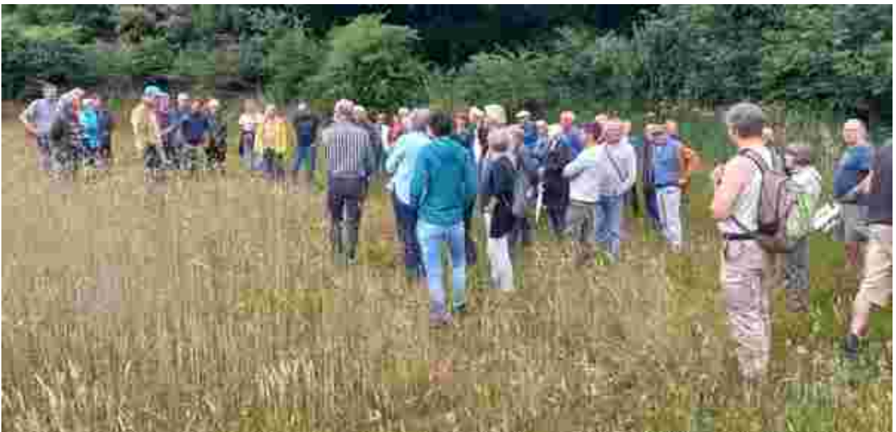
De midzomer avondexcursie op 21 juni

Januari 2023, Arno van der Kruis Bart Willers www.ploegdriever.nl/waldboeren