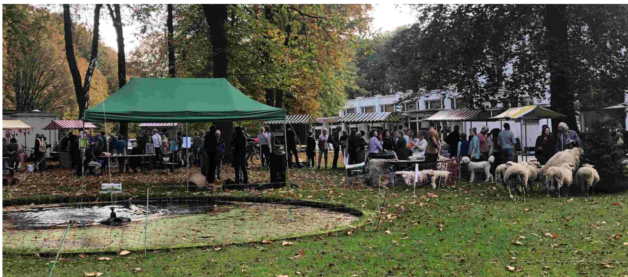
De Oogstmarkt op 30 oktober bij hotel Erica