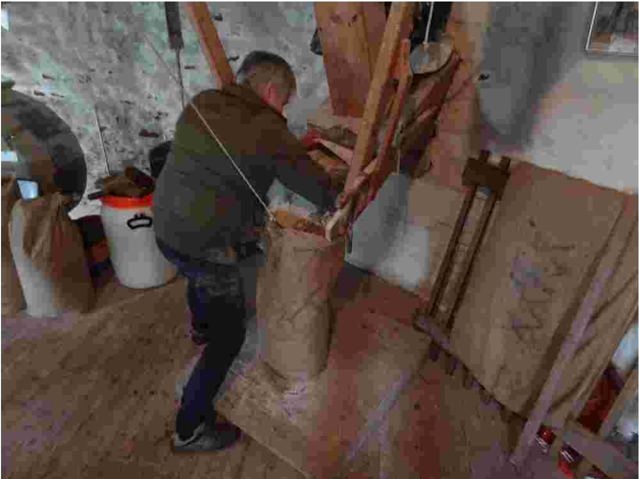
De spelttarwe van de oogst 2021 wordt gemalen op windmolen 'de Reus' in Gennepe

In augustus werd met maaisel uit natuurgebied de Bruuk een tweede Bokashihoop opgebouwd.