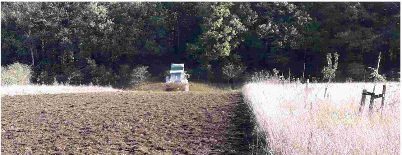
Uitrijden van Bokashi

In mei werd de hoop voor het eerst geopend en werden vele kruiwagens gefermenteerde Bokashi naar de jonge bomen en struiken gereden en onder de bomen en struiken uitgestrooid (zie foto). Het donkergekleurde structuurrijke strooisel had de aangename geur van bosgrond. In juli werd onder hete en droge omstandigheden Bokashi uitgereden op de gemaaide en gehooide delen van het grasland. Toen verspreidde zich een zure lucht die een paar dagen aanhield. In november werd voor de derde keer Bokashi verspreid, nu over de akkerstroken. Ook toen rook het zuur en de lucht bleef vele dagen hangen. Buurtbewoners aan het Klappeijenpad hadden er veel last van.